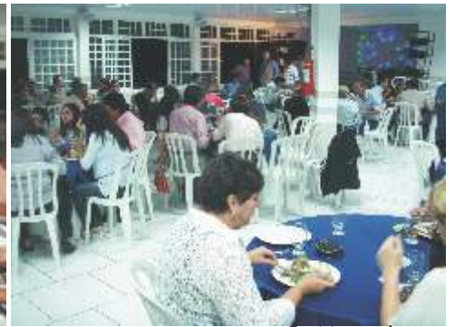
Participantes do evento