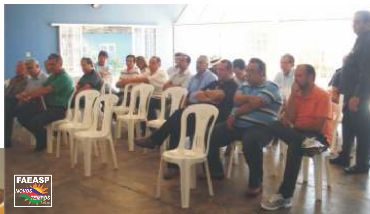
Reunião com lideranças da UNACEN em Bebedouro