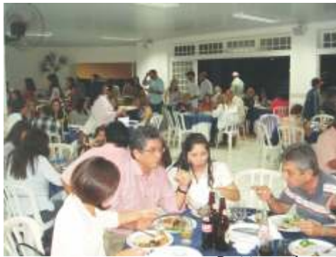
Participantes do evento