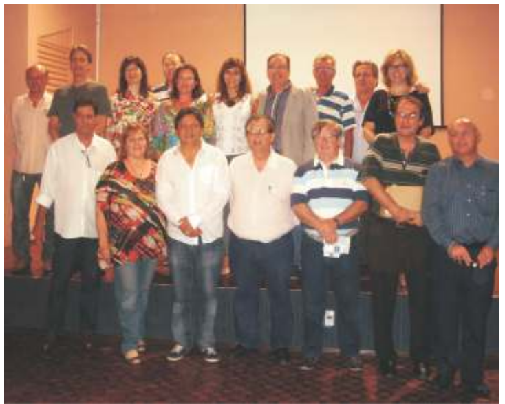
Participantes do evento na ASSENAG Bauru