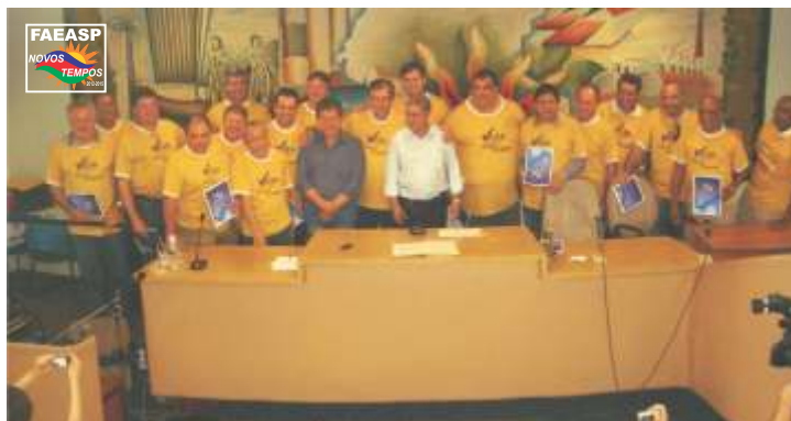
Integrantes da Diretoria Executiva e do Conselho Fiscal eleitos

Um grupo de diretores da administração da FAEASP gestão 2009/2012, visando as eleições, se reuniu no dia vinte e nove de março desse ano, às doze horas, na Churrascaria Coxilha dos Pampas, na cidade de Campinas, SP, para estudar a composição de uma chapa que efetivamente trabalhasse para o fortalecimento das associações, pela valorização profissional e para isso deveria ser independente financeira e politicamente do sistema Confea/Creas/Mutua. Após todos se manifestarem e