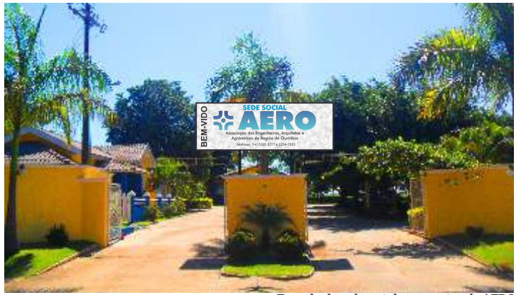
Entrada da sede social e recreativa da AERO