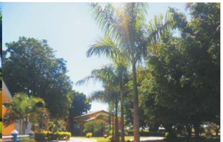
Sede social e recreativa da AERO