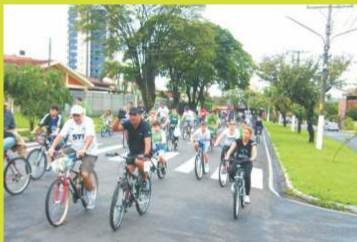
Passeio pelas principais avenidas da cidade