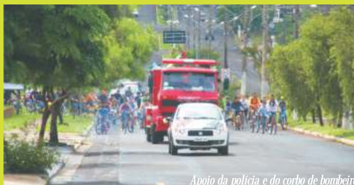
Apoio da polícia e do corpo de bombeiro