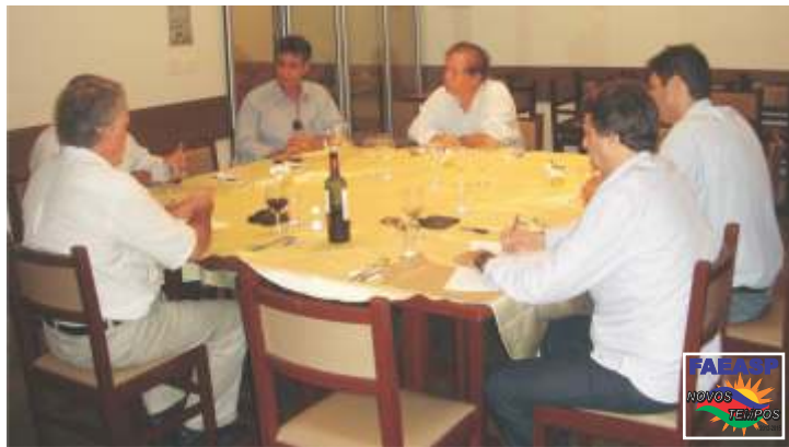
Reunião com lideranças da UALPM Santos, SP

apresentou o levantamento do número de associações, concluindo que as cento e sessenta e seis associações encontram-se agrupadas nas dez Uniões já nomeadas e identificadas nas reuniões anteriores da seguinte forma: UNARO - União das Associações da Região Oeste de São Paulo – treze associações – duas indicações; UALP - União das Associações do Litoral Paulista – treze associações – duas indicações; UNAOP - União das Associações do Oeste Paulista – trinta associações – três indicações; UNO - União das Associações do Noroeste Paulista – doze associações – uma indicação; UNACEN - União das Associações do Centro Norte – vinte e duas associações – três indicações; UNABAMM - União das Associações da Baixa e Média Mogiana – trinta e oito associações – quatro indicações; UNABAT - União das Associações do Alto Tietê – nove associações – uma