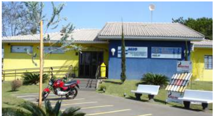
Moderna sede administrativa da AERO