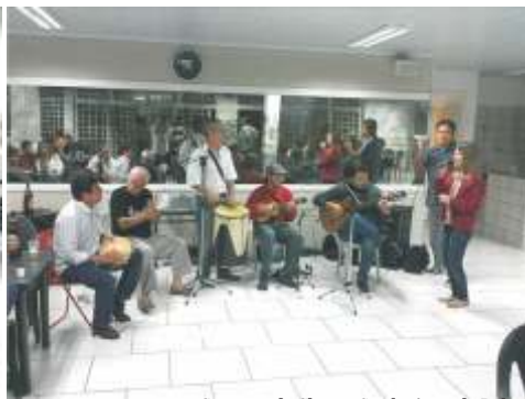
Conjunto de Choro e Samba Atrás do Balcão