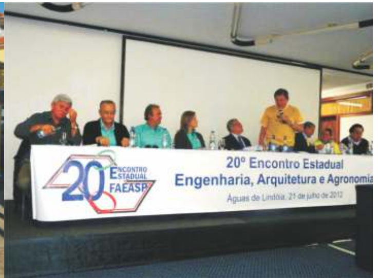
Abertura do encontro

A FAEASP – Federação das Associações de Engenharia, Arquitetura e Agronomia do Oeste Paulista, realizou no dia 21 de julho passado, o 20º Encontro Estadual de Engenharia, Arquitetura e Agronomia. O encontro aconteceu no auditório Firenze do Hotel Vacance, sito na Avenida das Nações Unidas, nº. 1374, Águas de Lindóia, SP e contou com a participação de Presidentes e Representantes de Associações das diversas regiões do Estado de São Paulo.