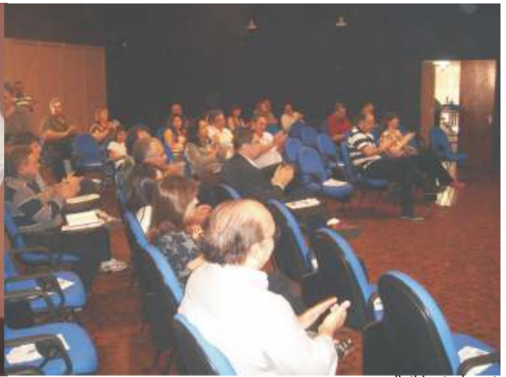
Participantes do evento