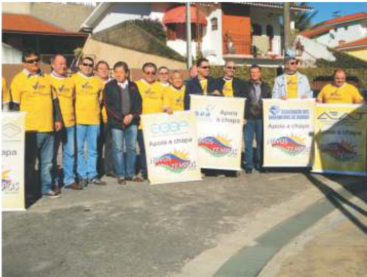
Integrantes e colaboradores da CHAPA NOVOSTEMPOS com camisetas e banners de apoio.