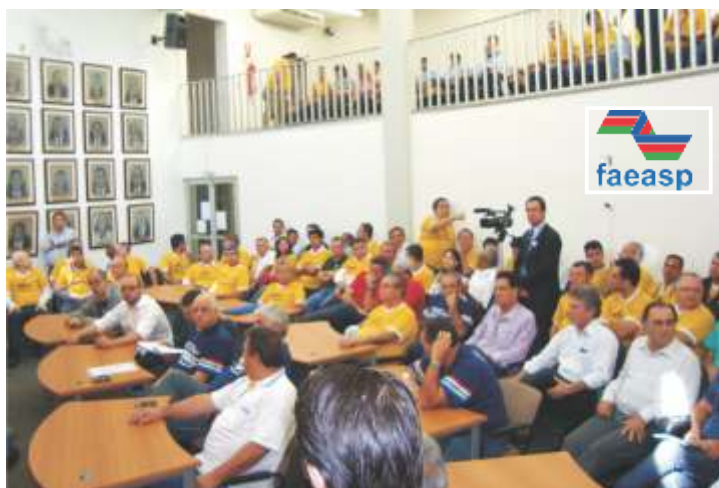
Representantes das federadas aguardam momento do voto no Plenário da Câmara

apresentarem suas opiniões, decidiu-se pela composição de uma Chapa onde seus integrantes fossem indicados pelas associações, através de suas Uniões. Para isso, levantaram as Uniões que se reuniam frequentemente e que comprovavam suas atividades através de atas, sendo elas a UNARO - União das Associações da Região Oeste de São Paulo, UALP - União das Associações do Litoral Paulista, UNAOP - União das Associações do Oeste Paulista, UNO - União das Associações do Noroeste Paulista, UNACEN - União das Associações do Centro Norte, UNABAMM - União das Associações da Baixa e Média Mogiana, UNABAT - União das Associações do Alto Tietê, UNASP - União das Associações do Sudoeste Paulista, UNAVAP - União das Associações do Vale do Paraíba e UNASETE - União das Associações das Sete Cidades do ABC e decidiram que os Coordenadores dessas Uniões seriam convidados para participar da próxima reunião, realizada no dia onze de abril, no mesmo local.