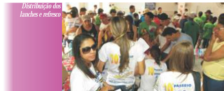
Distribuição dos lanches e refresco