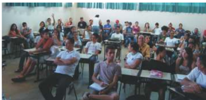
Turma de Edificações e Automação Industrial do período da tarde