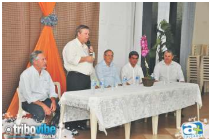
Presidente da FAEASP enaltece trabalhos da AEAPE