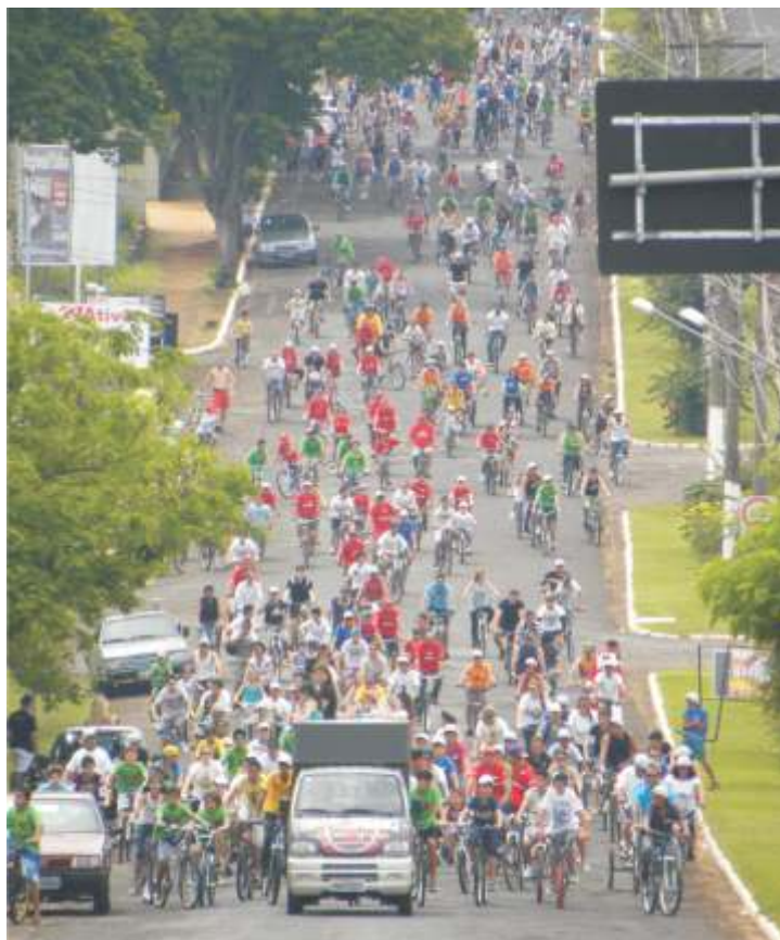
Vista do Passeio