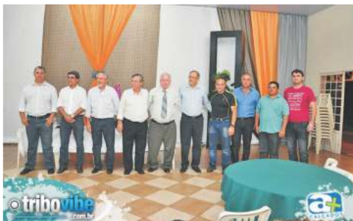
Pres. da FAEASP e o Prefeito com a Diretoria da AEAPE