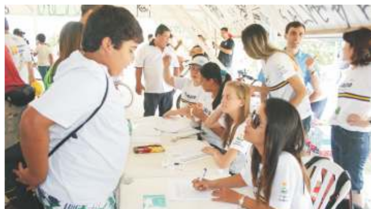
Inscrições do passeio