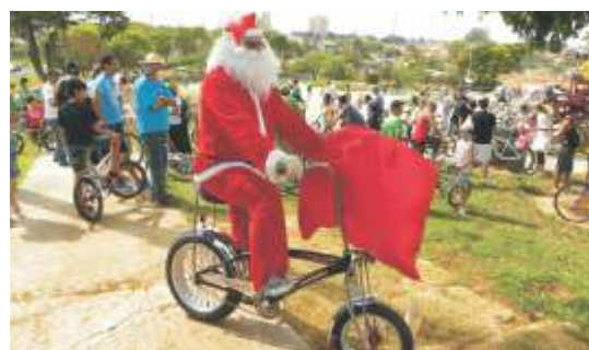
Papai Noel chegou mais cedo e participou do passeio ciclístico

Power Print, 1 pela Rodtel Telecom, 1 pela Strutural Blocos e Pavimentação, 1 pelo Varejão Santa Catarina e 1 pela Farmácia Bom Pastor. Também foram distribuídos 200 mudas de árvores frutíferas (amora, jabuticaba, goiaba, pitanga e ipê), 300 kits de materiais didáticos de educação ambiental e de inclusão social através da acessibilidade pela Empresa PB Lopes Concessionária Scania, idealizadora do Projeto Social Ipê Amarelo da APAE, 1500 lanches, 250 litros de refresco Ninfa, 500 sorvetes e muitos saquinhos de pipoca e algodão doce. As crianças se divertiram com a cama elástica e o tobogan disponibilizados pela AERO.